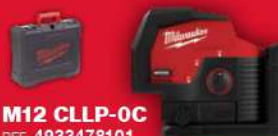
M12 CLLP-0C REF. 4933478101

Nivel láser de 2 líneas y plomada M12™, verde, ajuste fino, protección IP54. Incluye pinza para techos y tarjeta de alta visibilidad