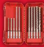
Estuche 10 brocas SDS-Plus MX4™ REF. 4932492115