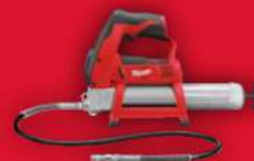
M12 GG-0 REF. 4933440435