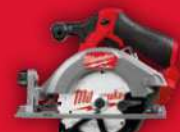
M12 FCS442-0 REF. 4933493488

Sierra circular subcompacta M12 FUEL™, diámetro del disco 140mm, máxima profundidad de corte 46mm, 3.600rpm