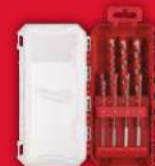
Estuche 8 super brocas REF. 4932493881