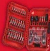
Estuche de 70 piezas SHOCKWAVE™ REF. 4932492007