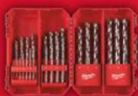
Estuche 25 brocas Thunderweb HSS-G REF. 4932493870