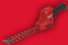
M12 FHT20-0 REF. 4933479675

Recortasetos de mano M12 FUEL™, cuchilla de 20cm, capacidad de corte 9,5mm, velocidad en vacío 2.700v/min, espacio entre dientes 8mm