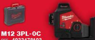
M12 3PL-0C REF. 4933478103

Nivel láser de 3 líneas M12™, verde, ajuste fino, 330° de rotación, protección IP54. Incluye pinza para techos y tarjeta de alta visibilidad