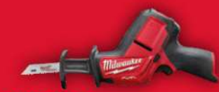
M12 CHZ-0 REF. 4933446960

Sierra de sable subcompacta de una mano M12 FUEL™ HACKZALL™, carrera 15,9mm, 0-3.000cpm, FIXTEC™